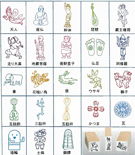
1. スタンプ(23種) 各¥324 ミニ説明付