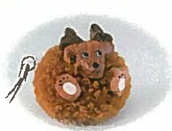
37. しかぼっくり ¥540