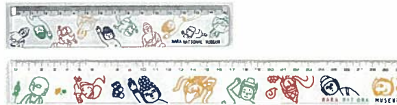
6. 定規(15cm) ¥288 7. 定規(30cm) ¥396