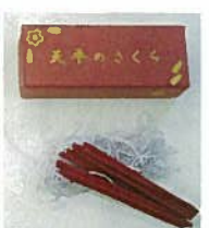
36. 天平のさくら ¥1,296 (40本入)