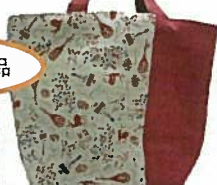
13. トートバッグ(大) ¥5,940 赤・紺 27cm×33cm 底マチ13cm