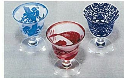
27. 食前酒グラス 各¥10,280 琵琶・鳥・鏡