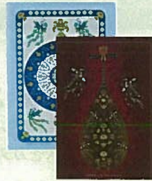
19. A4ファイル 各¥324