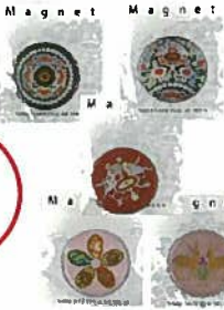
49. マグネット 各 ¥324