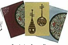
8. ブックカバー 各¥972 琵琶 赤・紫・ベージュ 鏡 赤・紺・水色