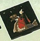
22. 手鏡(小) ¥972 全長12cm