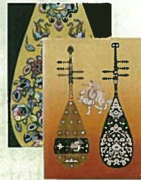
20. 金箔ファイル 各¥540