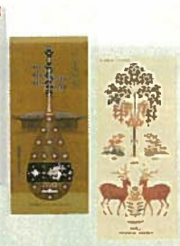
16. アートクリップ 各¥270