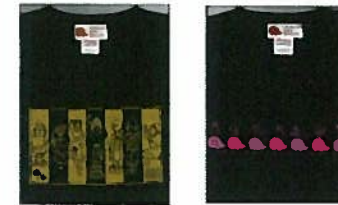
14. Tシャツ長袖 各¥3,024 S.M.L 男女兼用 (四角)黒(雲)紺・茶