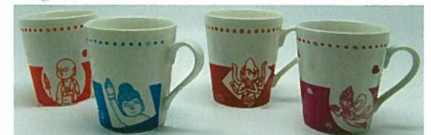
18. マグカップ 各¥875