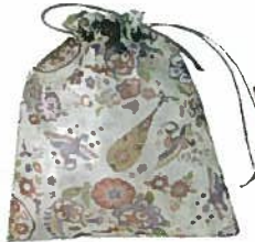
7. 巾着 ¥1,296 30cm×25cm