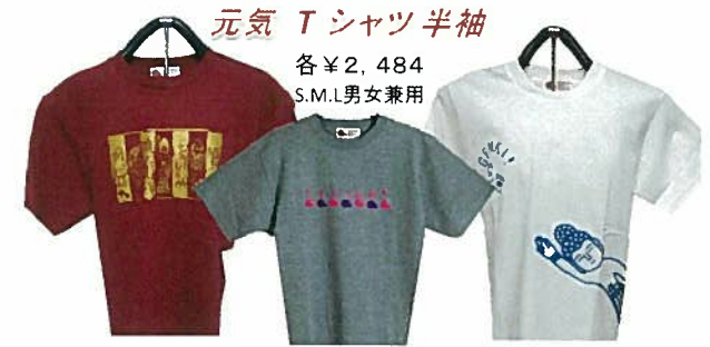
11. (四角) 赤・グレー 12. (雲) グレー・茶 13. (釈迦) 白・黒