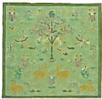
2. チーフ鹿 ¥756 緑・からし・オレンジ 50cm×50cm 綿100%