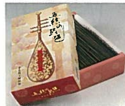
34. 線香 五絃の琵琶 ¥1,620 (200g)