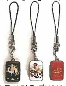
50. アートストラップ ¥648