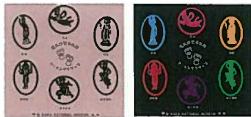
2. マーキングクリップ (6個入 シルバー・カラー) 各¥540