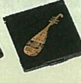
23. トレー ¥1,404 21cm×15cm