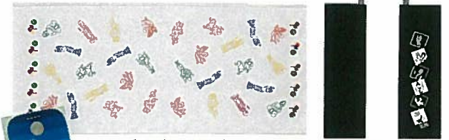
16. ガーゼたおる 各¥756 サイズ35cm×82cm