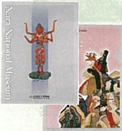
18. A4ファイル 各¥270