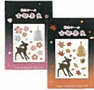
42. 蒔絵シール 各 ¥463