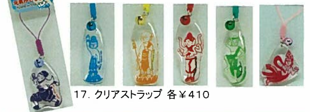
17. クリアストラップ 各¥410