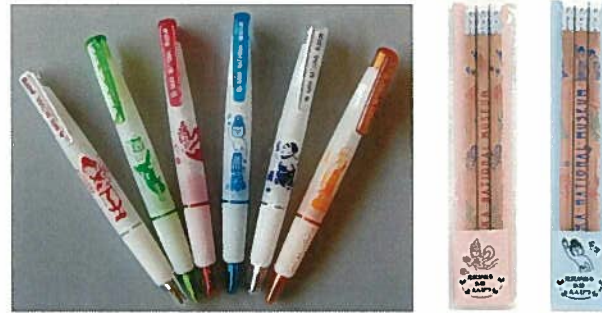
4. ボールペン(黒) 各¥324 5. 鉛筆(3本) 各¥180 1本 ¥60