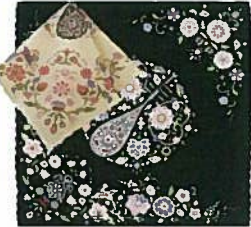
3. 更紗ハンカチ 各¥1,296 白・黒 56cm×56cm 綿100%