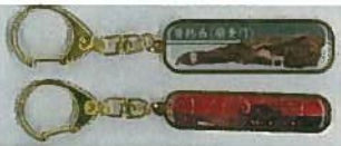
46. キーホルダー 各 ¥864