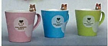
44. マグカップ鹿付 各 ¥1,080