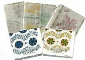
9. ふきん 各¥540 表綿100% 5枚合わせ 40cm×40cm