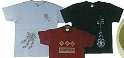
4. Tシャツ 各¥2,700 花喰鳥・人勝残欠・琵琶 白・黒・エンジ S・M・L 男女兼用