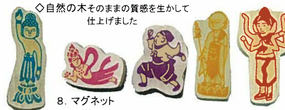
8. マグネット (木製) 各¥324