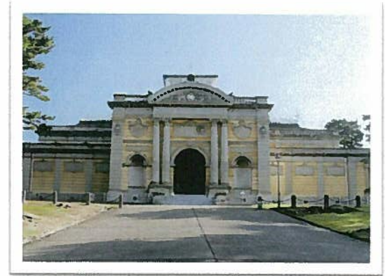
NARA NATIONAL MUSEUM

ご注文は _____ お電話・ファックスで、商品名・個数をご連絡頂きますと折り返し、代金・送料・送金方法等をお知らせいたします。