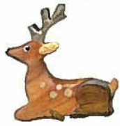
38. マグネット鹿 木製 ¥540