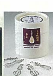
17. 琵琶クリップ ¥864 30コ入