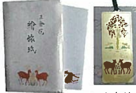
40. 懐紙 ¥390 30枚入