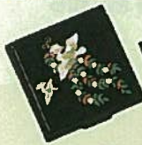
21. コンパクト鏡 各¥1,080 7cm×7cm