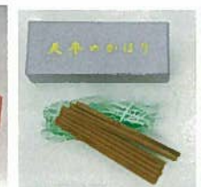
35. 天平のかけり ¥1,080 (40本入)