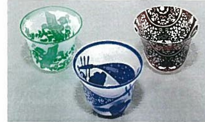
26. 冷酒グラス 各¥7,920 琵琶・鳥・鏡