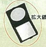
24. 宝石箱 ¥2,700 16cm×11cm 高4.5cm