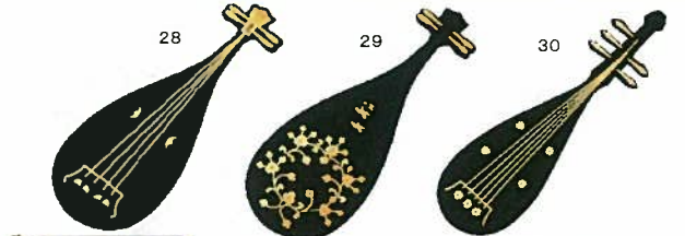
28.29.30.ブローチペンダント 各¥3,996 (桐箱入・18金メッキチェーン付)