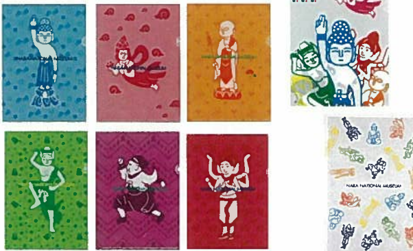
9. ミニ・クリアファイル 各¥194 10. A4ファイル 各¥270