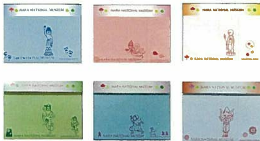
3. ふせん 各¥378