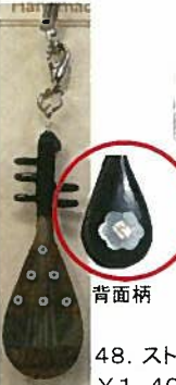
48. ストラップ ¥1,404