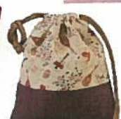
14. 巾着 ¥2,700 赤・紫・紺・緑 23cm×20