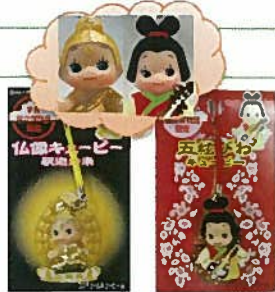
47. キューピー 各 ¥540