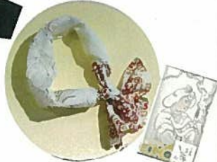
5. ロングハンカチ 各¥1,080 赤・黄 95cm×25cm 綿100%