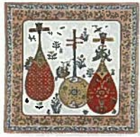
1. チーフ琵琶 ¥756 オレンジ・ブルー・緑 50cm×50cm 綿100%