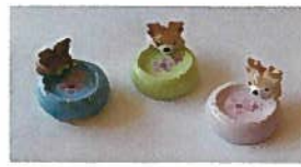
45. 箸置 鹿付 各 ¥540